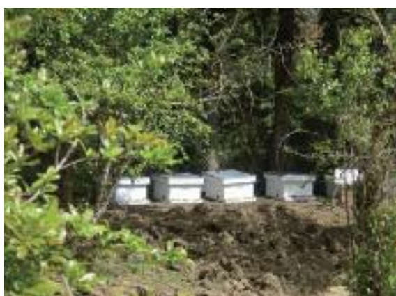
Microprojets scolaires (compostage, cultures sous serres...)