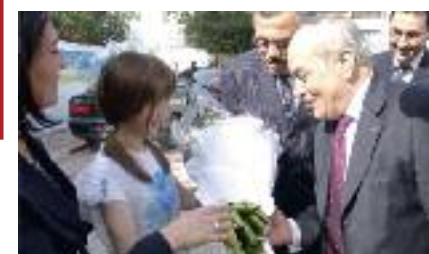
lancement de la phase pilote par le Ministre de l'environnement et du Développement Durable